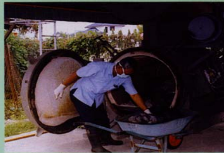
Gambar 4: Karkas ayam, itik dan burung peliharaan di incinerate bagi mematin virus HPAI