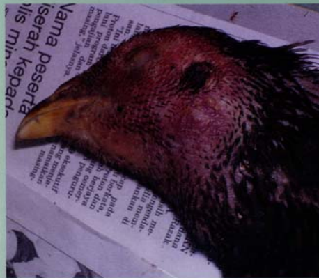
Gambar 1: Kepala ayam dijangkiti virus avian influenza jenis H5N1 bengkak dan berwarna merah hingga ungu