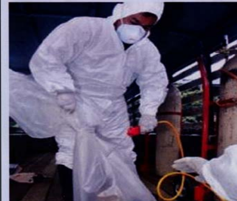
Gambar 3: Ayam, itik dan burung peliharaan dimatikan menggunakan gas karbon dioksida. Kaedah ini diiktiraf oleh Badan Kesihatan Haiwan Sedunia (OIE)