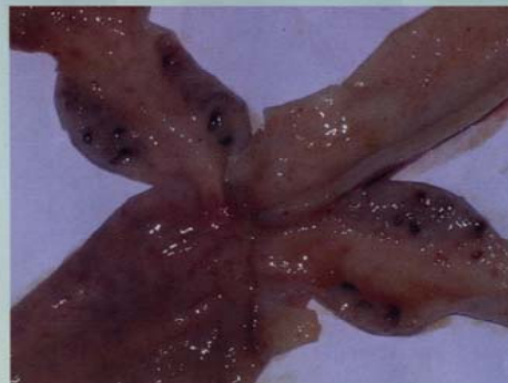
Gambar 2: Pemeriksaan post-mortem menunjukkan kesesakan dan/atau pendarahan organ-organ seperti pada tonsil sikum